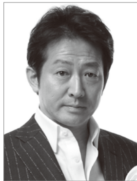
ご案内 辰巳 琢郎 Navigator Takuro TATSUMI

豊かな音楽性を礎に国内外の主要オーケストラと数多く共演を重ねている。最近では「ディズニー・オン・クラシック」の客演指揮者として三度の全国ツアーを成功に導いた他、日本フィルハーモニー交響楽団横浜定期や九州公演ツアーに客演し、好評を得た。2024年には洗足学園創立100周年記念公演祝祭音楽劇『MATEKI』の指揮と音楽監修を担当。オペラの分野にもその活動の場を広げている。