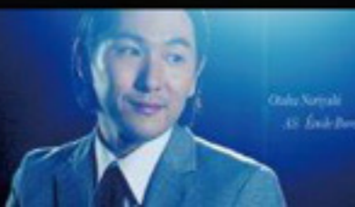
Akira Aji AS: Jack Black