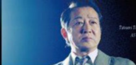
Takumi Takano AS: Physics

「放射能」の名付け親。二度のノーベル賞受賞者。核物理学の夜明けを告げた偉大な学者。唯一無二の女性マリ・キュリー。前近代と近代の狭間、二十世紀初頭という時代に、女として、母として、学究の徒として、己の人生を切り開いた偉大な女性。彼女を取り巻く家族や友人と共にその後半生を描く。