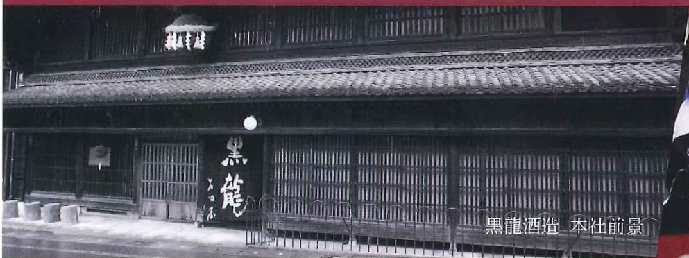
黒龍酒造 本社前景