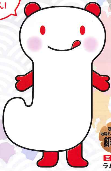
地場もん国民大賞公式キャラクター じぼもん